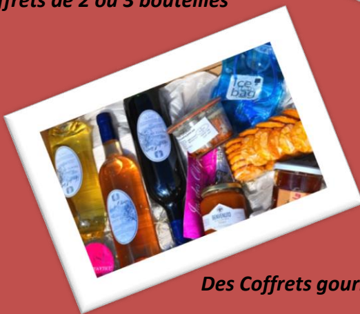
Des Coffrets gourmands ou dégustation